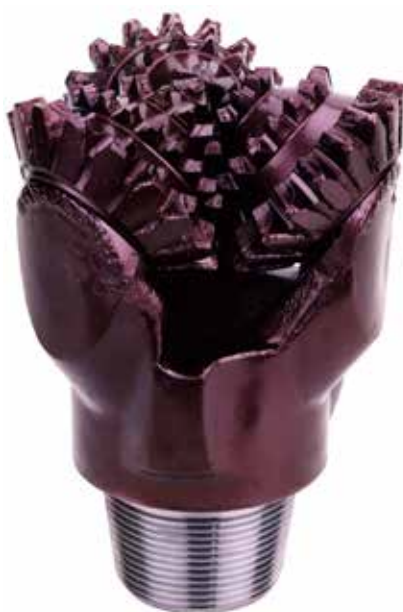
Долота с фрезерованным вооружением