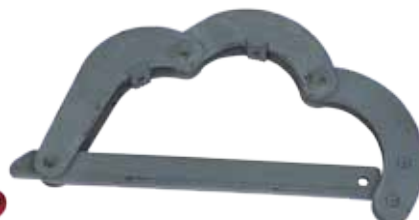
Ключ КШС 168/188