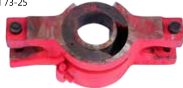
Элеватор ЭХЛ 73-25