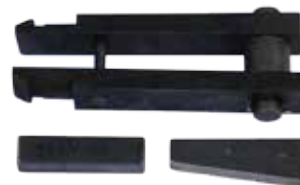
Приспособление для выемки седел