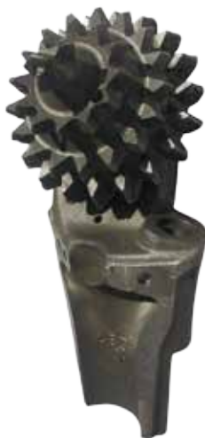
Секция шарошечного долота