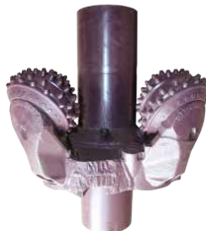
Расширитель шарошечный с твердосплавным вооружением