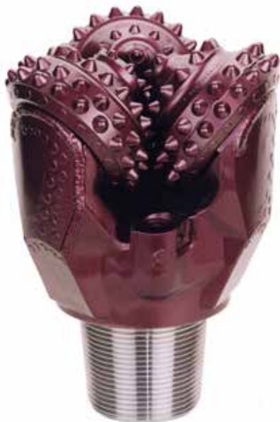
Долота с твердосплавным вооружением