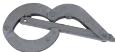
Ключ КШС 219/243