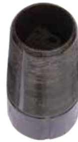
Метчик ловильный ДЗ