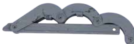
Ключ КШС 146