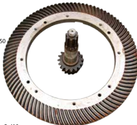
Пара ротора P-410