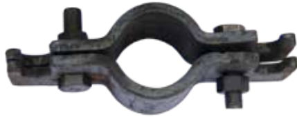
Хомут диаметр 146