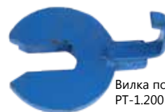
Вилка подкладная РТ-1.200