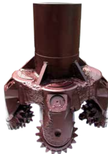
Расширитель шарошечный с фрезерованным вооружением