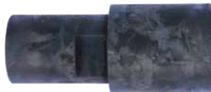
Переводник муфтовый М50/88